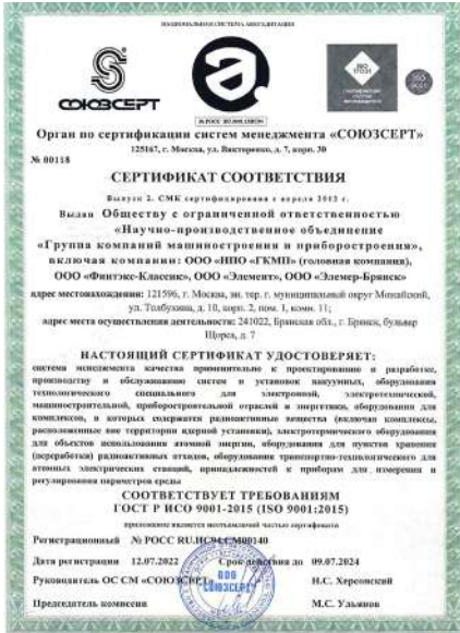
Сертификат СМК с приложением лист 1