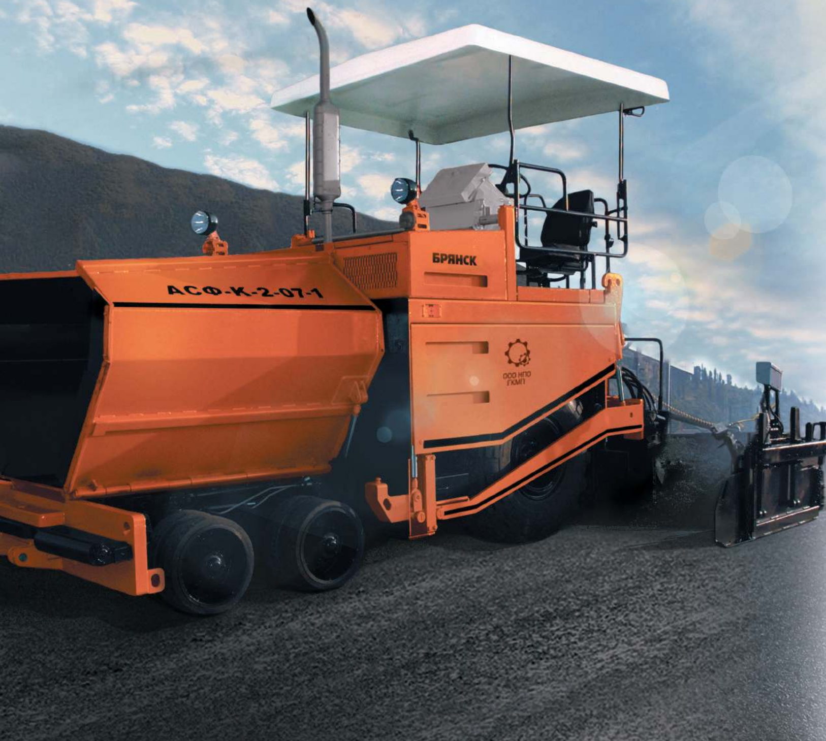
Плита рабочая (пр)