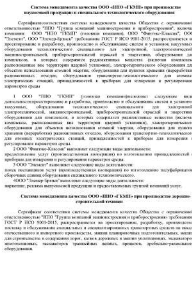
Система менеджмента качества ООО «НПО «ГКМП»