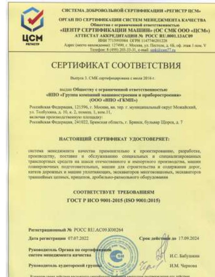
Сертификат СМК Дорожная техника