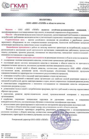
Политика в области качества