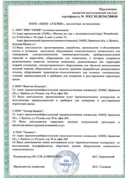
Сертификат СМК с приложением лист 2